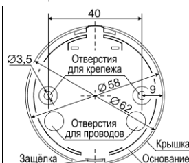
Рис.3 Задняя стенка.

к ППКОП со знакопостоянным ШПС. Величина резистора Rок определяется в соответствии с техническим описанием ППКОП