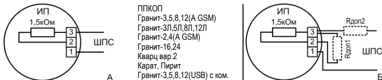
Рис.1 Схемы подключения извещателя к ШПС